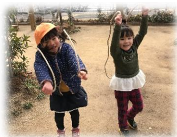
なわとびがんばるぞ!

自分の事だけでなく、周りのことにも気付けるようになってきた子どもたち。給食の時間には、「お箸の持ち方はこうだよ」などと、年下の友だちに優しく声を掛け、手本を見せる場面が増えました。日々ぶどう組の姿を見て学んだり、刺激を受けたりし、「はやくぶどう組になりたい」という期待感が高まってきているようです。最近では、“鉄棒の逆上がり”、“縄跳びの後ろ跳びやけんけん跳び”など、難しいことにも積極的にチャレンジしていますよ。