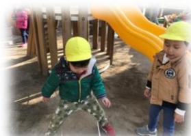
ゴムとびにも挑戦♪