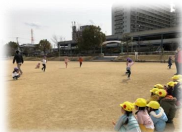
ぶどう組のなわとび チャンピオン大会を 見学中…