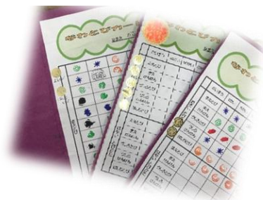
なわとびチャンピオンの シールです☆