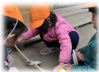
ひとりで結べるよ